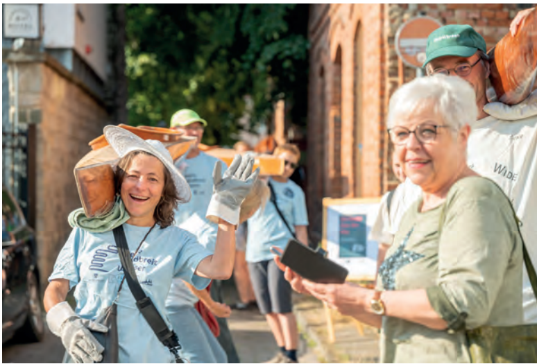
Bildunterschrift: Stationen der Boot-Karawane.